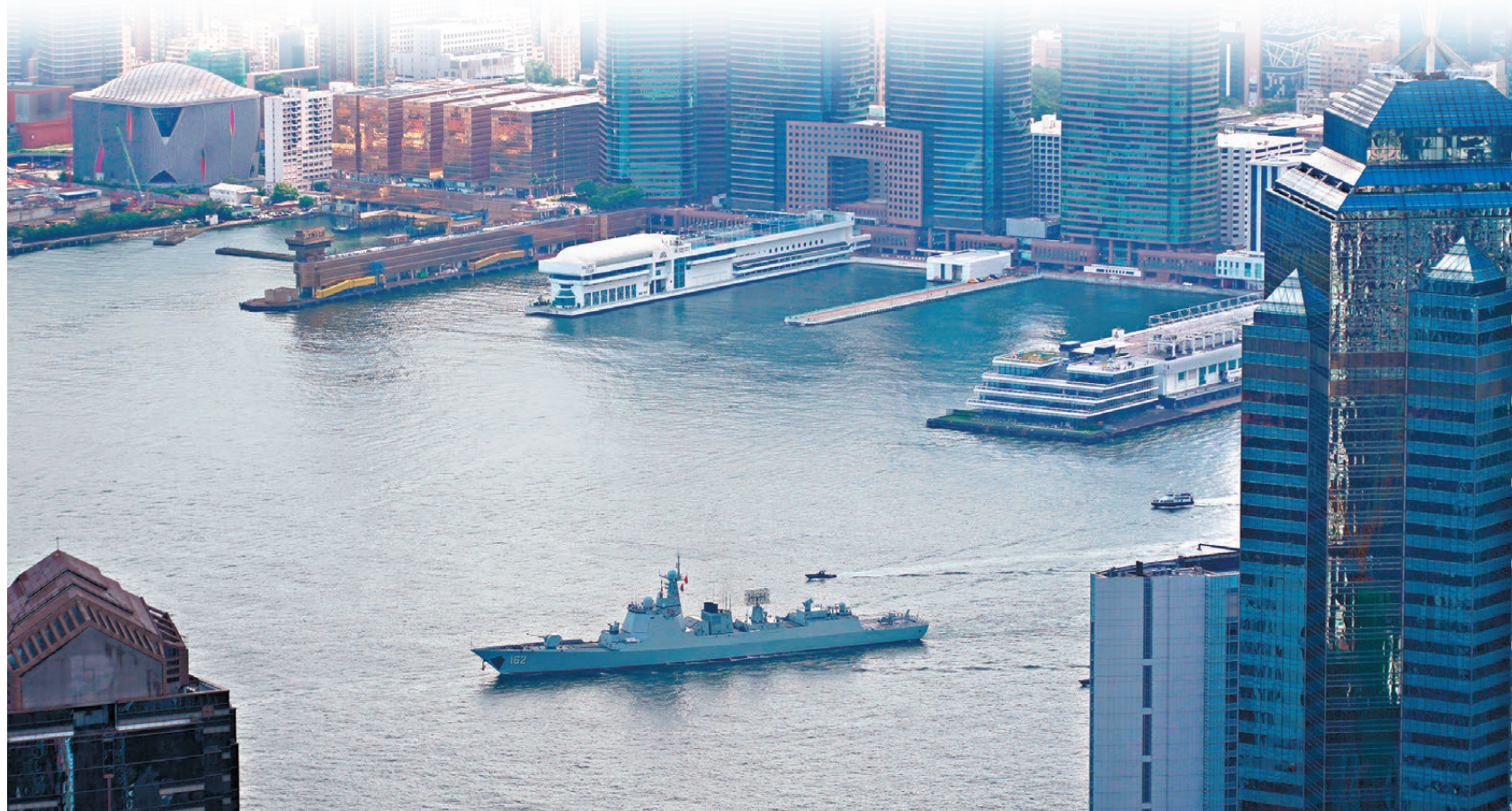
●南寧艦昨日早上進入尖沙咀對開的維港海域。

他強調，中國海軍暢遊維港的一幕正是國家實力強大的體現，他相信香港市民參觀軍艦後，定可加深認識解放軍是威武文明之師，增強民族認同。