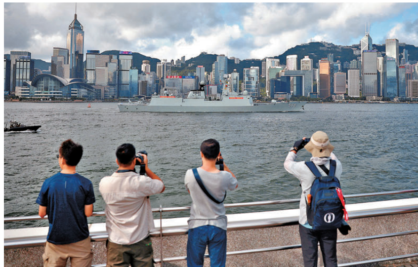
●不少市民高舉鏡頭捕捉珍貴畫面。