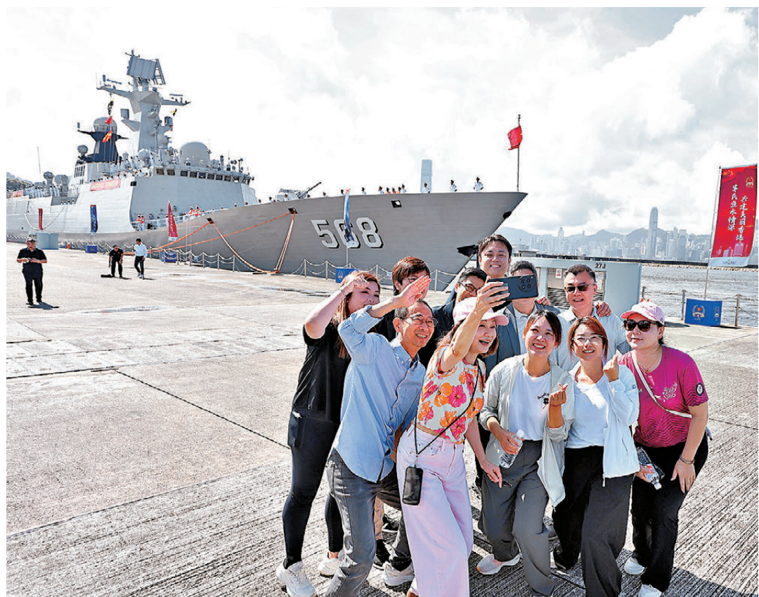
●參觀者在衡陽艦前留影。