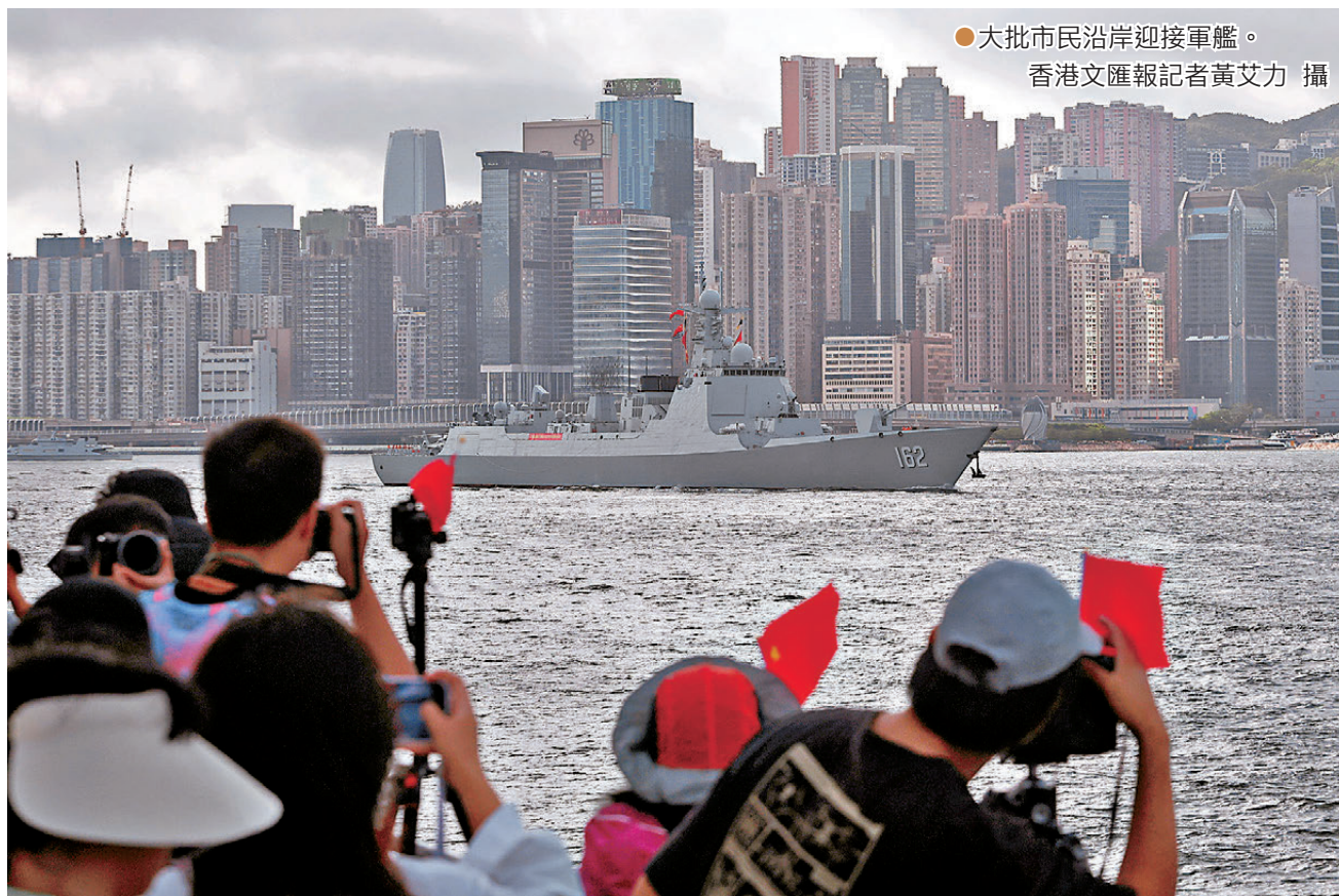
●大批市民沿岸迎接軍艦。