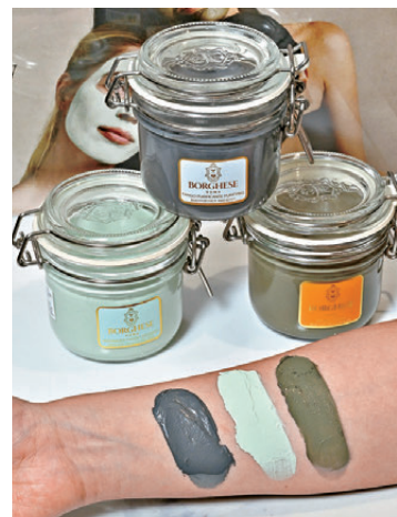
▲三款皇牌泥漿面膜（綠泥、升白泥、黑泥）