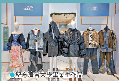
●聖方濟各大學畢業生作品