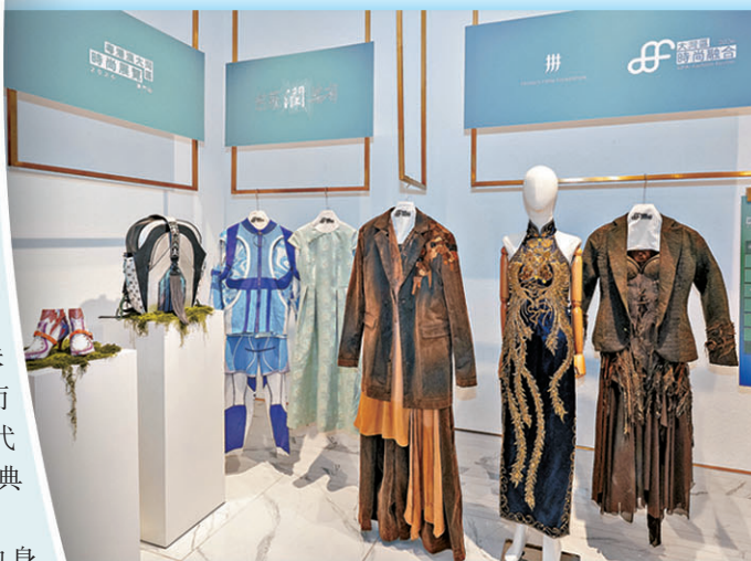
●惠州學院旭日廣東服裝學院畢業生作品