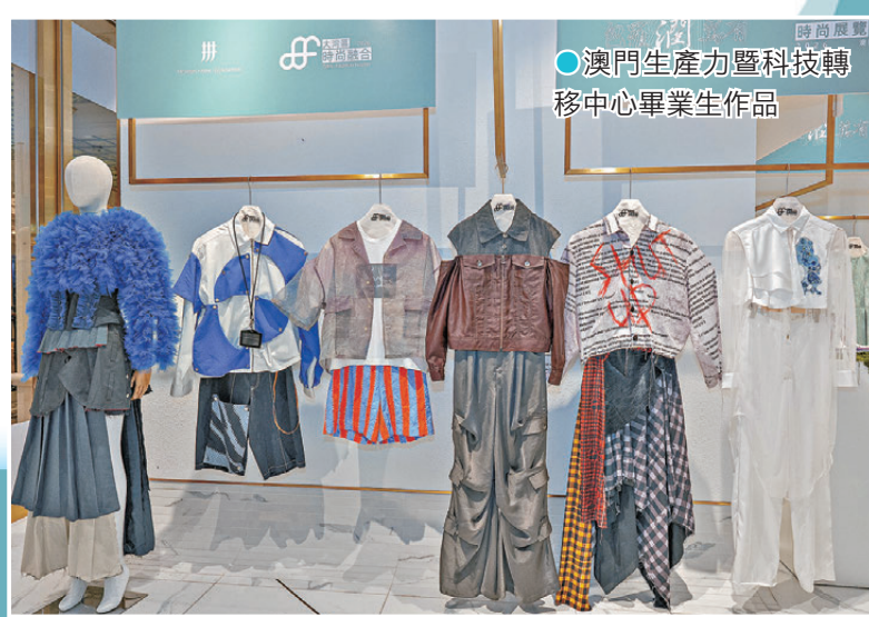
●澳門生產力暨科技轉移中心畢業生作品