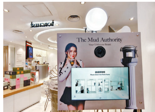
▲ Chantel 限定驚喜禮遇