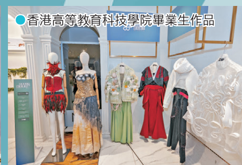
●香港高等教育科技學院畢業生作品