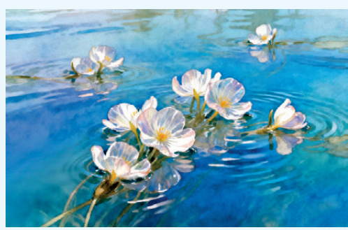
●白花花一片，比雪乾淨，比石頭篤定。 AI繪圖