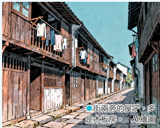
街兩旁的屋子，多是木板房。 AI繪圖

街中段有塊略微寬敞的空地，是我們的「宇宙中心」。男孩們拍洋畫、滾鐵環，煙塵飛揚；女孩們跳皮筋、抓石子，歌聲清脆。最期盼的，是「磨剪子戥菜刀」的吆喝聲，和補鍋匠那副挑子「叮鈴咣啷」的聲響。只要他們一出現，整條街便像過節。大人們拿出鏽鈍的刀