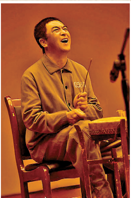
●張嘉益對秦腔有深厚情感。

「每個人都是自己人生的『主角』。」由著名導演張藝謀監製，李少飛執導，張嘉益任藝術總監兼主演，劉浩存、秦海璐、竇驍、翟子路、王曉晨、扈耀之、王海燕、孫浩等主演的內地熱播劇《主角》憑借貼近生活的劇情、細膩製作及演員精湛演繹，在內地掀起全民追劇熱潮，更在央視一套黃金檔創下單集最高收視率4.587%的成績，實現收視與口碑「雙爆」，被譽為「年度劇王」。張嘉益扎根陝西黃土地，與主創團隊深耕八年，慢火淬「主角」，寄語：「無論順境逆境，只要守好心、走好路、做好自己，你就是人生永遠的主角。」