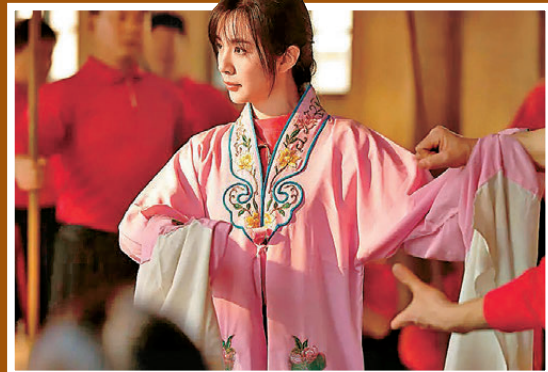
●王曉晨戲曲功底扎實。