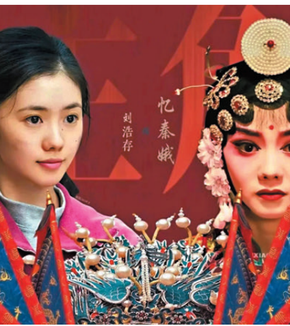
●劉浩存被「憶秦娥」堅守本心的執着所打動。 網上圖片