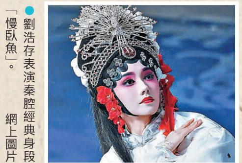
●劉浩存表演秦腔經典身段「慢臥魚」。