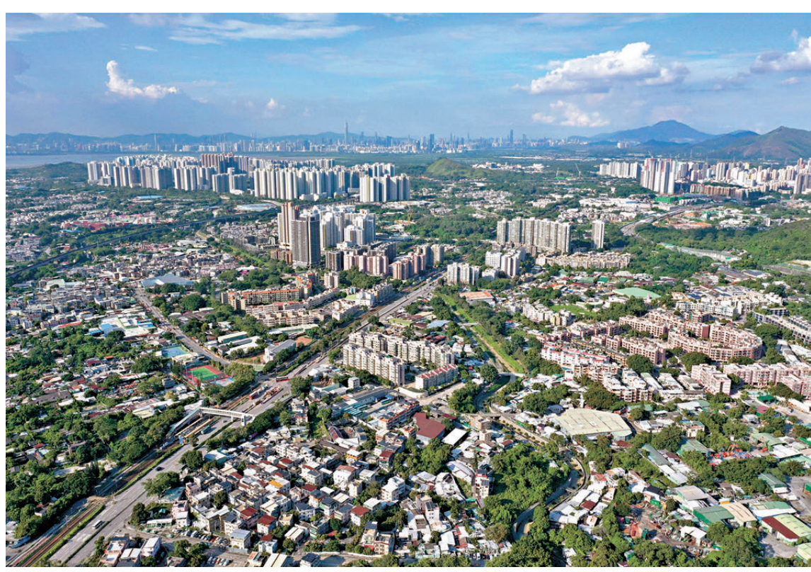
●洪水橋/厦村新發展區片區昨日中午截標。圖為洪水橋一帶環境。