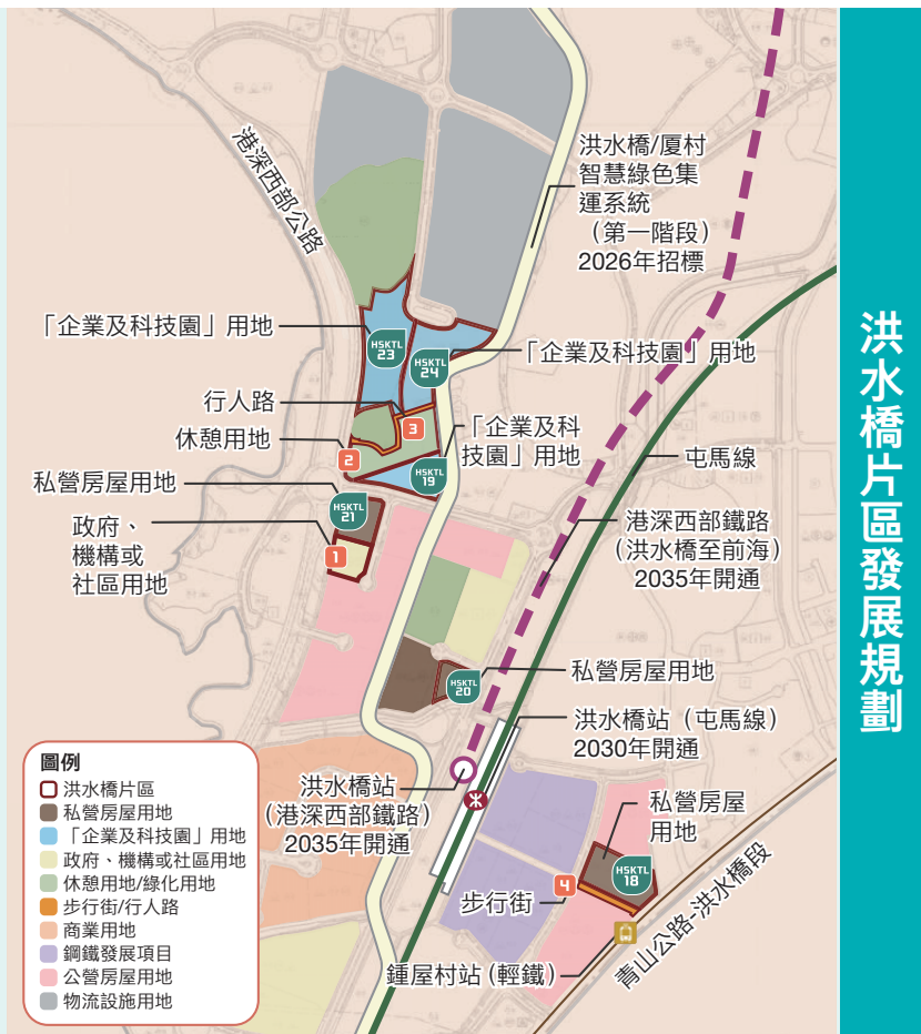
洪水橋片區發展規劃