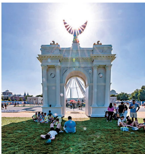
●破紀錄高溫影響民眾參與慶典意慾。圖為驕陽下人們在美國凱旋門模型的樹蔭下休息。

紐約市政府已開放數百棟公共建築物作為避暑中心，延長公共泳池開放時間，並派社工探訪高風險居民。市長馬姆達尼表示電網已超負荷運轉，呼籲民眾將空調溫度調至攝氏26度。此建議在社媒引發爭議，有網民認為當局應先關閉時報廣場的戶外照明，以節省電力。