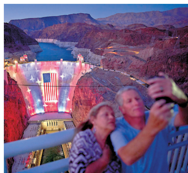
●人們打卡胡佛大壩上的美國國旗燈光。