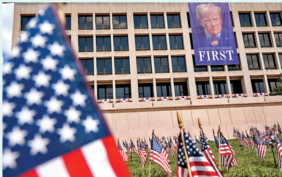
●美媒指特朗普正將周年紀念日變成一場關於他個人、而非整個國家的「政治騷」。圖為華盛頓國會山草坪旁，掛起一幅印有特朗普總統肖像的橫幅。