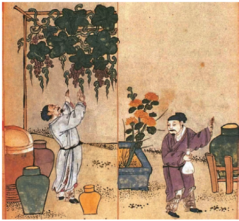
●《食物本草》中的插圖描繪了古代中國葡萄種植與釀酒場景。

漢唐時期經由絲路傳入的草木香料，長久以來都被上層社會壟斷，是難得一見的稀缺珍寶。而隨着時代更迭、航海技術發展，絲路貿易格局發生巨變，這些外來物產也慢慢褪去奢華外衣，走入尋常百姓家，更有遠渡重洋的美洲作物，徹底改寫了華夏農耕與飲食的歷史。