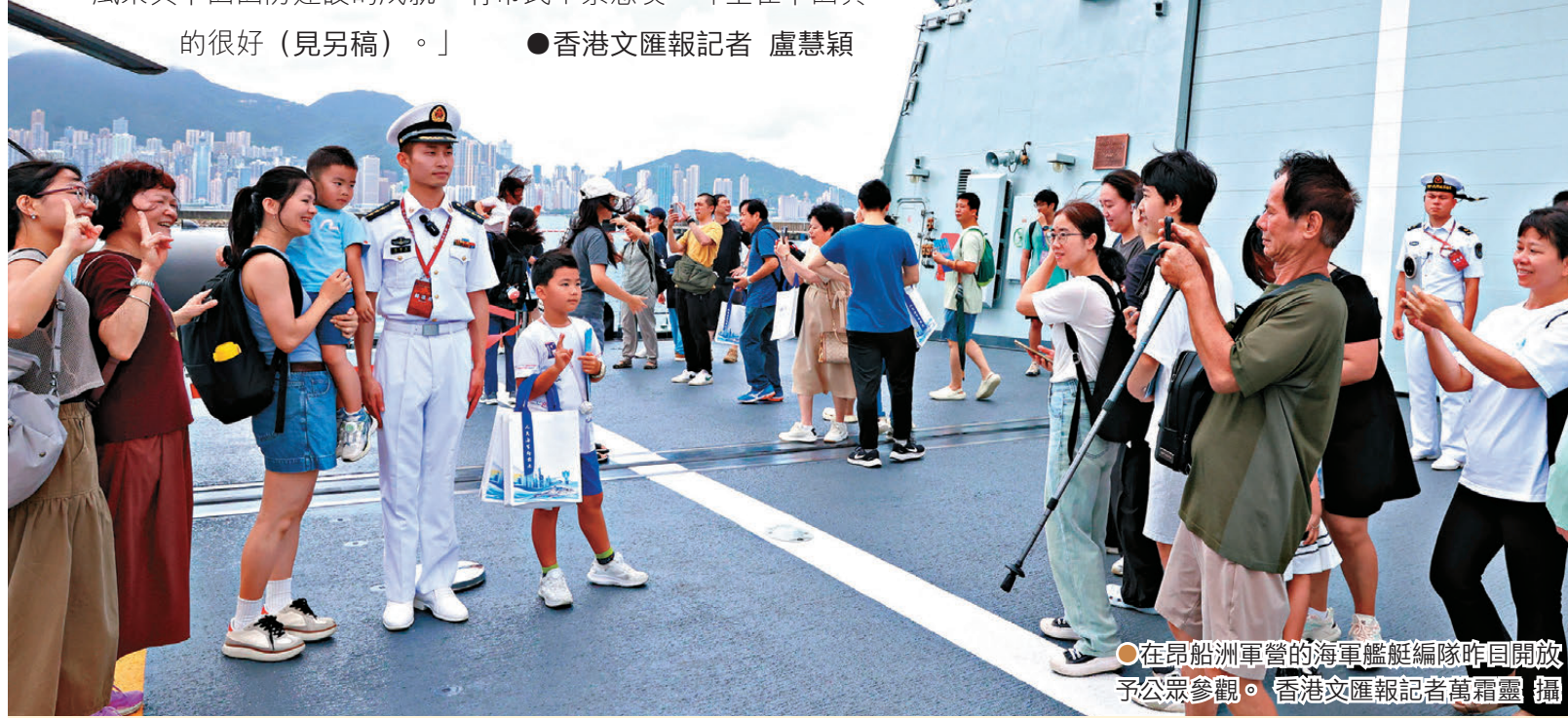
●在昂船洲軍營的海軍艦艇編隊昨日開放予公眾參觀。