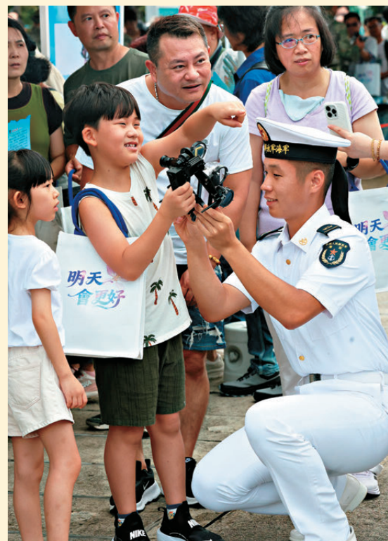
▲官兵與小朋友相處融洽。