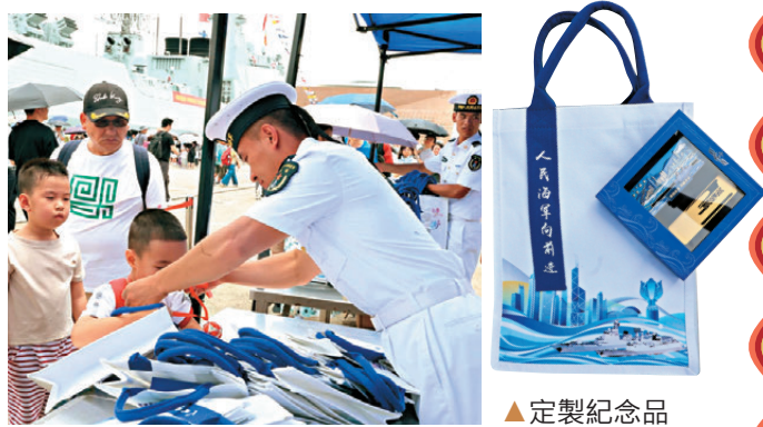
▲官兵為小朋友戴繡球。