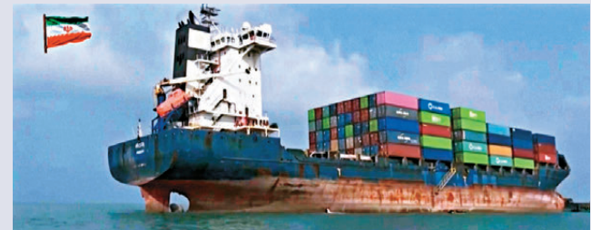
●伊朗國家電視台播出畫面，顯示一艘船在霍峽擱淺。

英國首相斯塔默與法國總統馬克龍3日發表聯合聲明，稱兩國將與阿曼合作保障其主權領海航運安全。伊朗副外長加里巴巴迪4日就此回應，霍爾木茲海峽不是域外國家進行軍事展示的场所，伊方反對任何可能影響該水道安全的軍事行動。