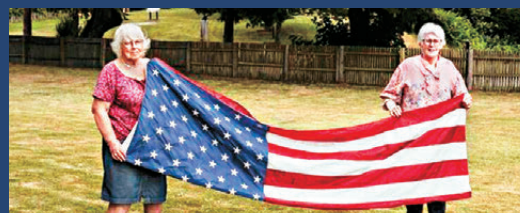
● 丹麥義工展示美國國旗。 網上圖片

然而美國總統特朗普揚言接管丹麥自治領地格陵蘭，令今年慶典氣氛蒙上陰影，也衝擊向來緊密的丹麥與美國關係。不少丹麥人開始質疑，為何要在丹麥土地上，甚至動用公帑，慶祝美國最具愛國色彩的節日。多年來反對活動的當地議員歐爾森痛批特朗普是「帝國主義瘋子」，並主導向主辦單位提出最後通牒：若不將美國官員移出活動流程，便取消相關經費與補助。主辦單位最終接受要求，美國官員退出官方活動，並表示美方使館官員對此感到遺憾，但接受決定。