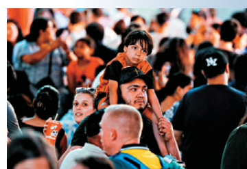
● 人們聚集紐約時報廣場慶祝。

香港文匯報訊 為慶祝美國建國250周年紀念日，華盛頓國家廣場舉行「偉大美國州博覽會」，特朗普總統還承諾舉行「有史以來最盛大、最壯觀的煙花慶典」。然而全美民意研究中心公共事務研究中心最新發布的民調顯示，僅約四成美國成年人對250周年國慶感到「驕傲」，僅約三成人感到「興奮」，其他人則對慶典持冷淡或矛盾心態。