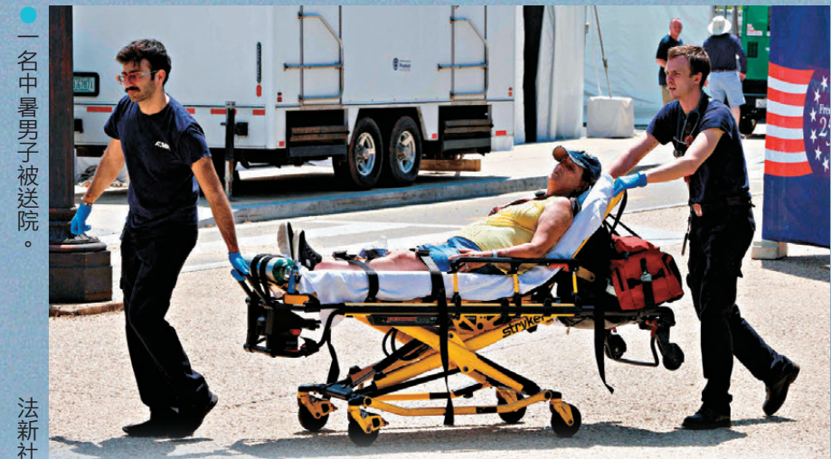
一名中暑男子被送院。

香港文匯報訊 美國中東部廣泛地區遭受致命熱浪侵襲，打亂建國250周年慶祝活動。首都華盛頓氣溫飆升至攝氏(°C) 38.9度，打破1872年創下的紀錄，國家廣場舉行的「美國州博覽會」被迫暫時關閉，賓夕法尼亞州氣溫也逼近38°C，至少一名當地居民因熱衰竭身亡，費城獨立紀念日遊行因極端高溫取消。紐約大都會區更有數千戶停電，在高溫下加劇人身安全危險。