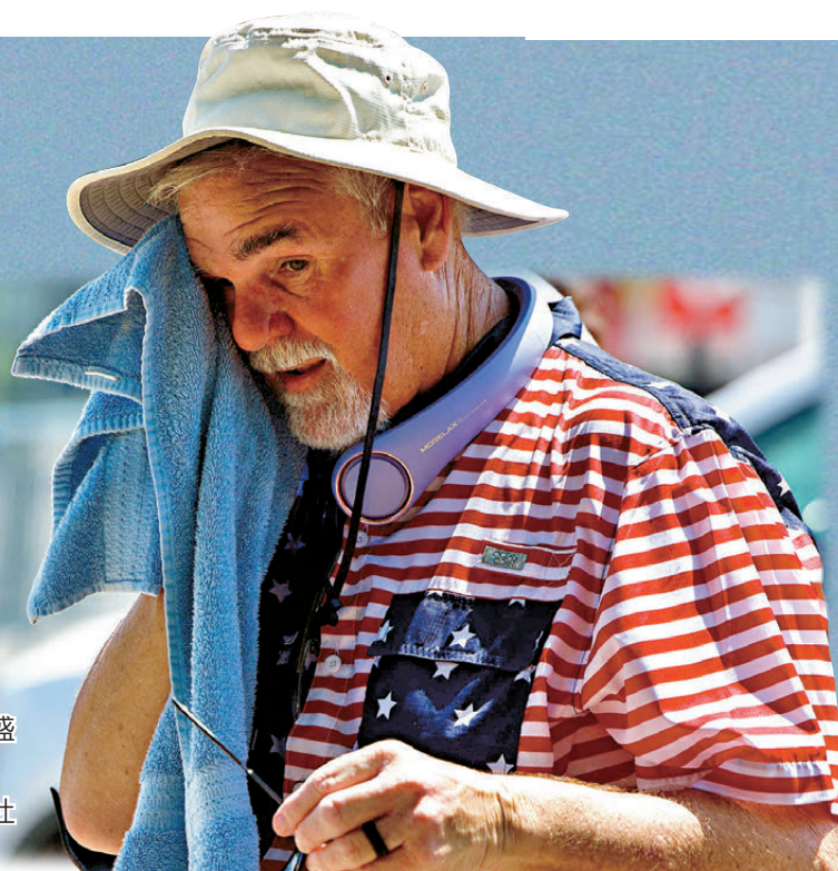
● 一名男子在華盛頓國家廣場抹汗。