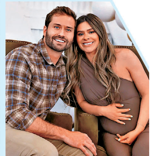
《摩門教人妻的秘密生活》將泰勒(右)家暴丈夫一事登上節目乘勢催谷收視。