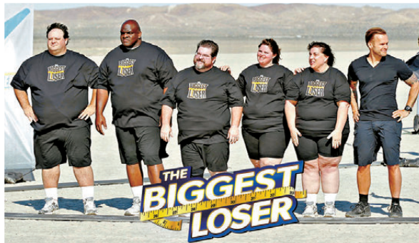
研究顯示即使只觀看一集《超級減肥王》，已足以讓觀眾對肥胖者產生更強烈的排斥感。網上圖片