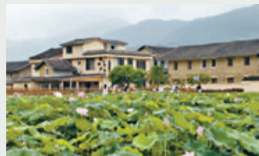
●和貴樓旁的荷花池中，朵朵荷花迎風綻放，映照着古樸的樓宇，構成詩意盎然的景致。