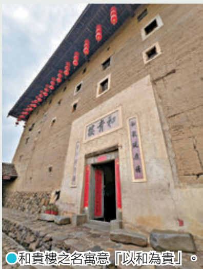
●和貴樓之名寓意「以和為貴」。

和貴樓以懸浮原理建造，採松木樁基與筏基，在3,000平方米的沼澤地上築起最高方形土樓，宛如陸上的「諾亞方舟」。其牆體高厚比在二百多年前便達到13:1，具有極高的建築技術研究價值。樓內設有兩口水井，一清一濁，被稱為「陰