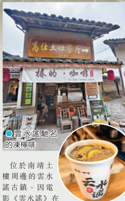
●雲水謠馳名的凍檸檬