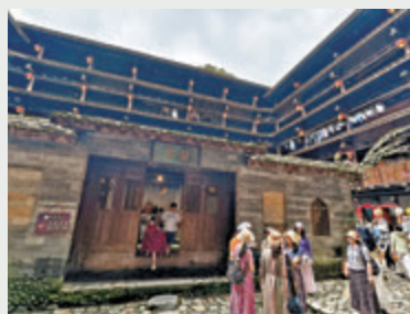
●和貴樓曾出過進士。