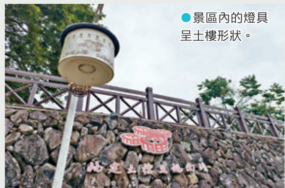
●景區內的燈具呈土樓形狀。