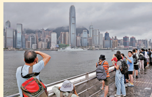
●岸上快門聲此起彼落。

香港文匯報訊（記者 李芍愨、朱欣欣）離港途中，熱情的香港市民們自發來到維多利亞港沿岸，目送艦艇編隊駛離。香港文匯報記者昨日約9時許抵達尖沙咀海旁，已見聚集大批撐傘市民，雨中歡送艦艇編隊。大約上午10時30分，兩艦先後解纜起航，汽笛聲穿透雨霧，岸上快門聲此起彼落，人群沿欄杆移動追望艦影，直至編隊駛出港灣，隱沒於灰濛海天一線，仍有不少人駐足良久，始陸續收起雨傘離去。