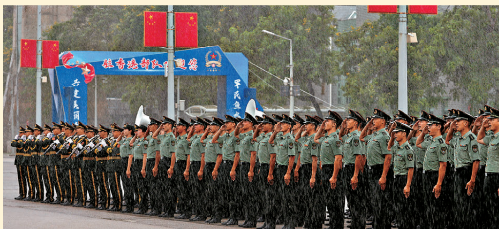
●滂沱大雨下，官兵身姿依然挺拔。