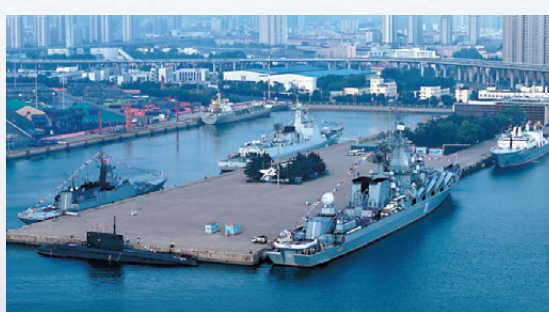
●7月5日在青島某軍港拍攝的參加中俄「海上聯合-2026」聯合演習的雙方艦艇。

中俄「海上聯合」演習始於2012年。本次演習以「聯合應對海上安全威脅」為課題，旨在展示雙方加強共同應對海上安全威脅、維護國際和地區和平穩定的決心能力，進一步深化中俄新時代全面戰略協作夥伴關係。