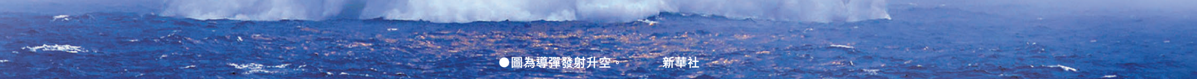
●圖為導彈發射升空。