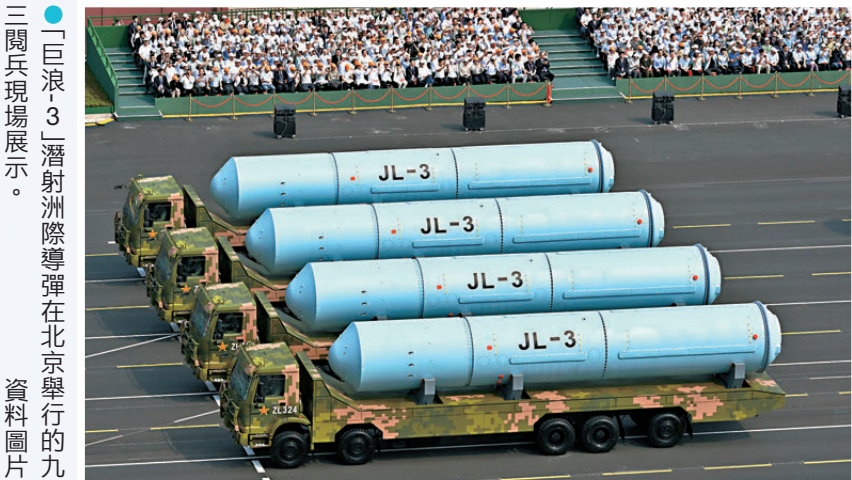
「巨浪-3」潛射洲際導彈在北京舉行的三閱兵現場展示。

據報，此次導彈發射是時隔兩年後，解放軍再度在太平洋公海海域開展導彈試射。2024年9月25日8時44分，中國人民解放軍火箭軍向太平洋相關公海海域，成功發射一發攜載訓練模擬彈頭的洲際彈道導彈，準確落入預定海域。那次發射據報道是中國自1980年5月18日東風-5全射程試驗後首次重返這片海域。