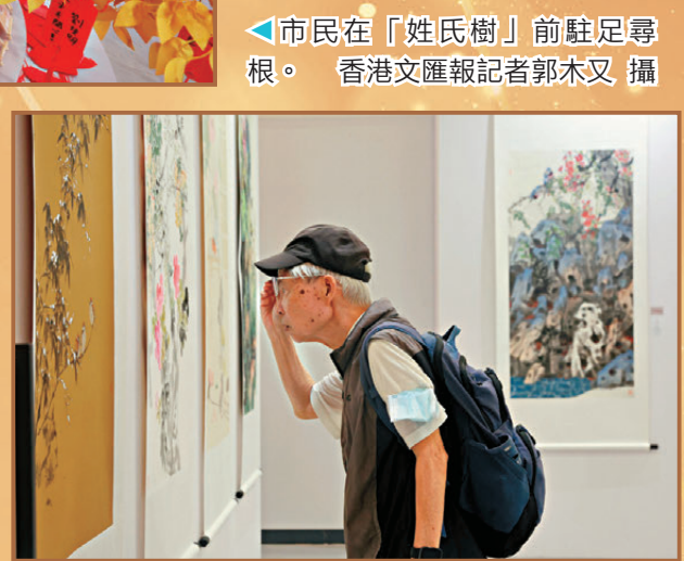
●市民駐足細賞書畫作品。