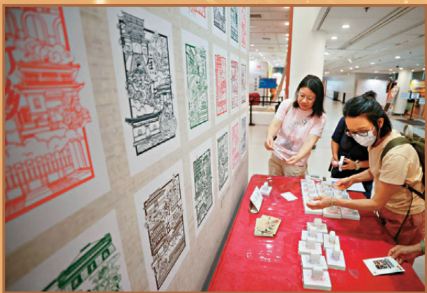
●市民蓋文創印章留念。