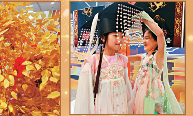
▲展覽現場，孩童試穿「武則天同款主題服飾」。