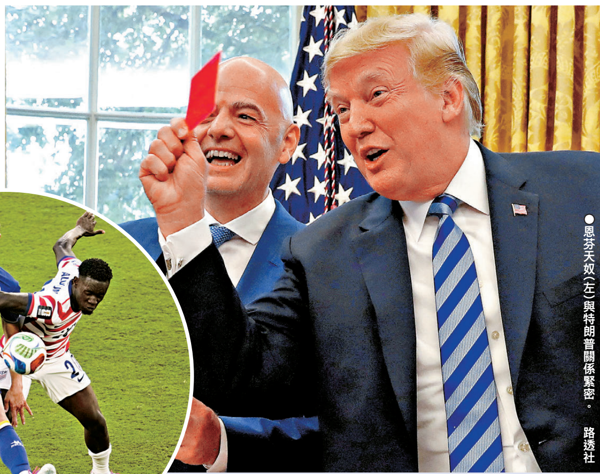
●恩芬天奴(左)與特朗普關係緊密。