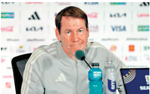
●加西亞斥決定違背足球精神。

香港文匯報訊 美國隊前鋒巴路官獲「特赦」後可以出戰比利時，國際足協(FIFA)的決定投下震撼彈。比利時皇家足球協會迅速就決定表示震驚，強調足協正研究採取行動。比利時隊主教練加西亞更直斥該決定違背足球精神：「我不知道在世界盃上，7月5日怎會變成了4月1日，變成愚人節。」