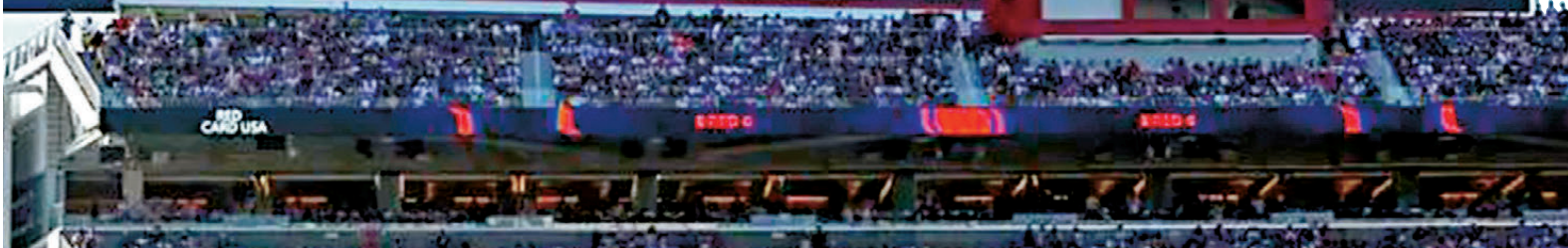
●巴路官在世界盃正賽中被罰紅牌後可繼續出戰，成史上第一人。