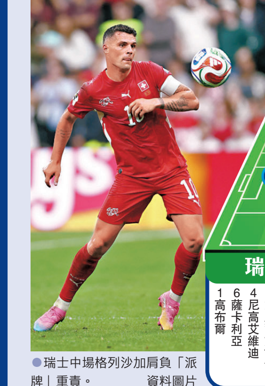
瑞士中場格列沙加肩負「派牌」重責。