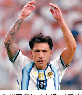
利辛度馬天尼斯已走出傷患陰霾。

球員特寫 阿根廷32強在佛得角的衝擊下搖搖欲墜，是中堅利辛度馬天尼斯的挺身而出保住了衛冕冠軍的尊嚴，這名身高只有1米75的「小巨人」交出一入球一助攻，助阿根廷苦戰120分鐘下終於艱難晉身16強。利辛度馬天尼斯雖然一直被視為當今球壇最好的中堅之一，但「玻璃」屬性卻限制了他的發展，去年二月左膝前十字韌帶撕裂，更令這位曼聯球員遠離賽場長達九個月。 「我不想再碰足球了。」當利辛度馬天尼斯聽到醫生評估他要養傷八個月至一年之後，他甚至萌生退役的念頭，「這是我受過最嚴重的傷，我跌到了谷底，非常痛苦。」幸好就在這時，利辛度馬天尼斯的女兒Aurora出生了，並成為了他走出至暗時刻的光，「看到妻子分娩的艱辛，我想：我怎麼能不繼續戰鬥呢？」他回憶道：「如果女兒沒有在我受傷時出生，我不知道我還能否站在这里，並在世界盃取得入球。」 利辛度馬天尼斯除了勇悍的球風，還擁有中堅罕見的出色技術，對佛得角一戰他先是送出一記超過40碼的精準長傳助攻美斯，再於加時以一記直飛死角的窄角度勁射助球隊再度領先，成為阿根廷死裏逃生的功臣，他以攻守兼備的表現擊散了所有質疑聲音，「我的家人、女兒和妻子一直支持着我。有時必須跌到谷底，才能重新升起，當我走上球場，我會為每一個球而戰。」利辛度馬天尼斯以一場浴火重生的好戲，向世界證明阿根廷從來不是美斯的「一人球隊」，這條崎嶇的衛冕路，全隊將會並肩走到最後。 ●香港文匯報記者 郭正謙