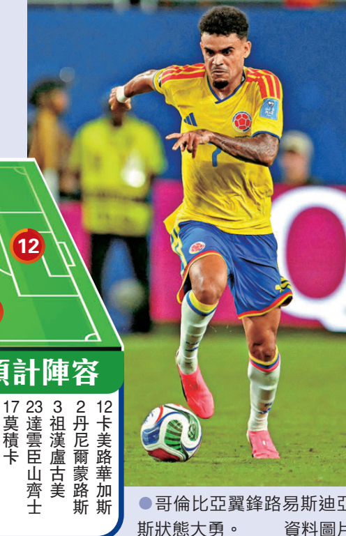
哥倫比亞翼鋒路易斯迪亞斯狀態大勇。資料圖片