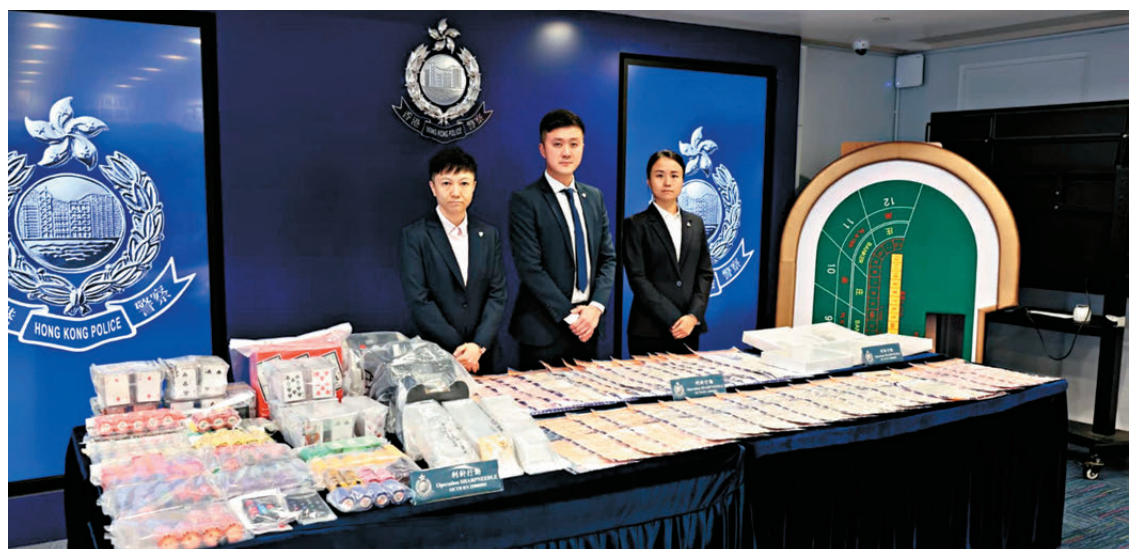
●警方展示行動中檢獲的現金及賭博工具等證物。