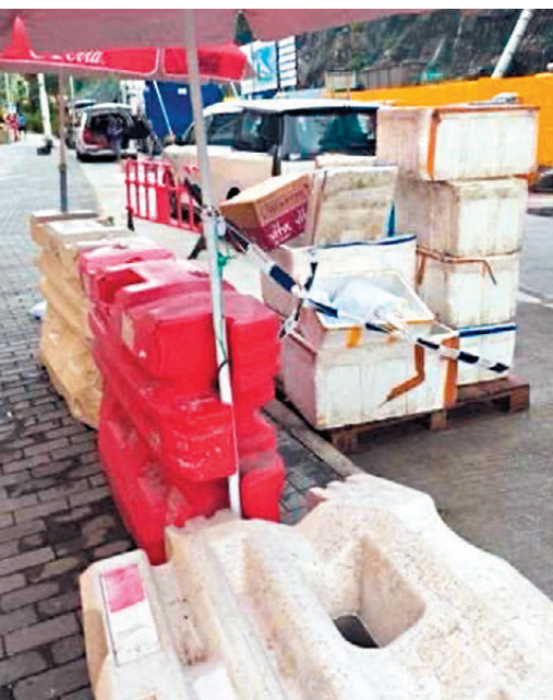
●圖為懷疑黑幫在地盤外出售飯盒的無牌販檔。

香港文匯報訊(記者 文森)漁農自然護理署推出全新本地漁農產品統一品牌「優鮮港品」，現時已有135個本地作物農場和水產養殖場等生產者參與，預計年底會增至超過500個。漁護署助理署長馬惠忠昨日在電台節目指，下一步計劃將本地豬、雞、活魚及蠔納入認證範圍，以提升本地漁農產品的競爭力。 馬惠忠指，「優鮮港品」是以本地、優質、安全、減碳為核心的品牌，可提升本地漁農產品形象，提升業界競爭力及收入，亦回應了市民對食物安全、來源透明度的期望。獲認證產品均須符合環境、用藥及水質等嚴格生產標準，並貼有專屬防偽二維碼供市民查閱來源，署方會透過定期抽查及產銷核對嚴把關，並設有舉報機制，一旦接獲投訴會立刻跟進。 另一方面，大家樂集團昨日宣布加入「優鮮港品」計劃，旗下大家樂快餐、Oliver's Super Sandwiches、意粉屋及上海蛇佬，會使用來自「優鮮港品」生產者認證證書持有人所提供的本地新鮮農產品食材，製作多款全新菜式，為市民提供優質且新鮮的選擇，帶來最地道、富有香港本土特色的「港味」。所有菜式即日起於上述品牌的指定分店發售。 集團指出，本地食材運輸距離短，不僅更新鮮，亦能減低碳排放，積極促進環境可持續發展。四個品牌同時簽署「優鮮港品同行者約章」，承諾採用本地食材之餘，亦積極參與推廣本地漁農產品、加強公眾教育，推動本地漁農業發展，共同締造更可持續的綠色社區。