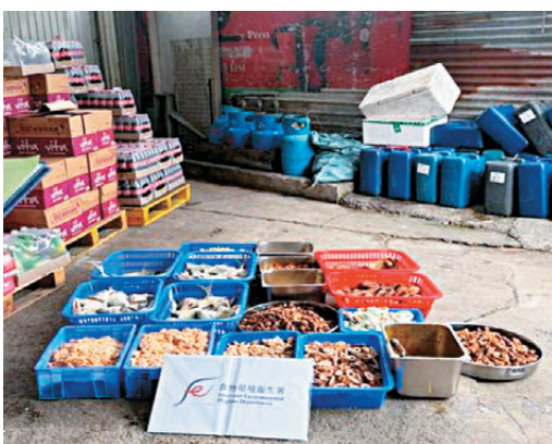
●警方日前聯同食環署搗破由黑幫操控的無牌食品製造工場和食肆、無牌販檔等。

至上周六凌晨，警方再搗破該黑幫於西九龍區經營的4個賭檔，以涉嫌經營賭博場所、協助經營賭博場所及在賭博場所內賭博拘捕116名男女(22歲至81歲)，檢獲約50萬元現金和值約170萬元的賭博工具。