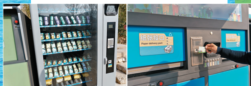
●居民使用垃圾分類積分卡換取生活用品。