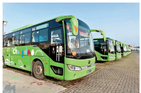
●全島旅遊大巴、旅遊包車、公交車全部實現新能源化。