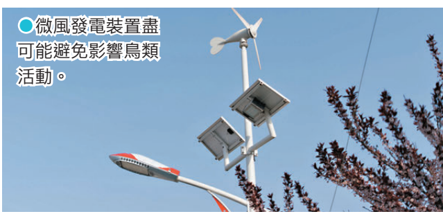
●微風發電裝置盡可能避免影響鳥類活動。