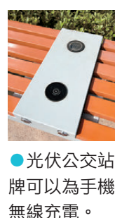
●光伏公交站牌可以為手機無線充電。