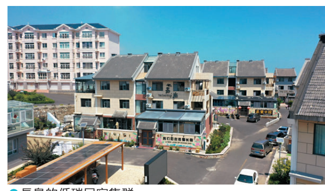
●長島的低碳民宿集群。