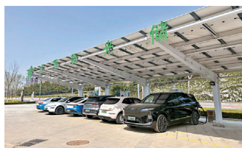
●島上的光儲充電站，充電樁累計建成約180個。