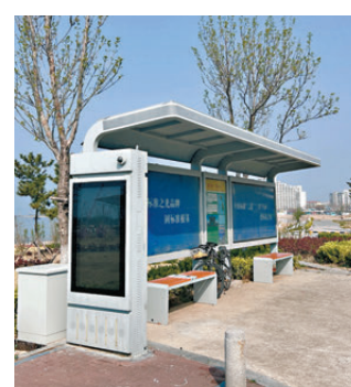
●環島路上的光伏公交站牌。