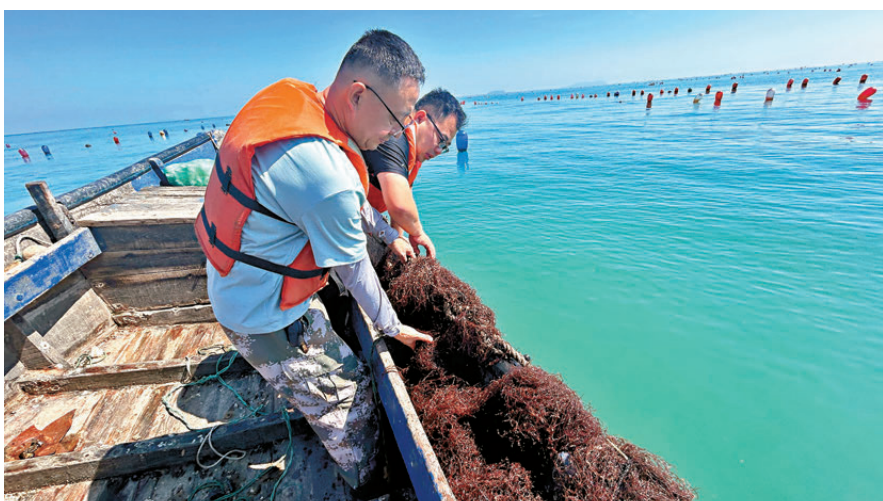
▼村民養殖海藻修復海洋牧場。