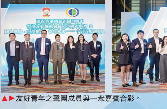
▲友好青年之聲團成員與眾嘉賓合影。