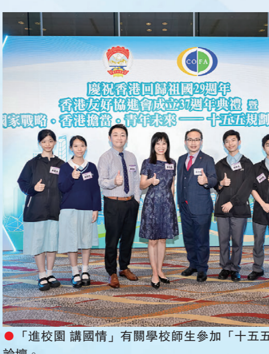
●「進校園講國情」有關學校師生參加「十五五」規劃發展論壇。