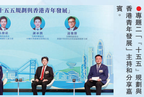
●香港青年發展「十五五」規劃與香港青年發展