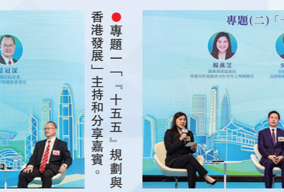
●專題二「十五五」規劃與香港青年發展