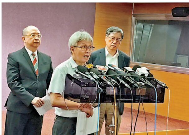
▲人類生殖科技管理局公布提供輔助生育服務的日常醫療中心事故。