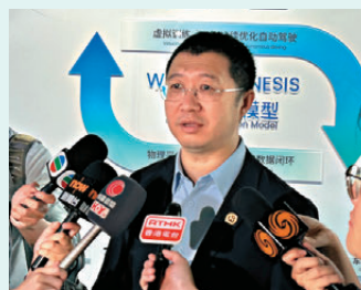
文遠知行韓旭

太空經濟的戰略窗口期。銀河航天作為中國商業航天領域的領軍企業，將持續探索與香港各界開展交流，期待與香港各界攜手並進，持續深化交流合作，在服務國家戰略中彰顯擔當，在全球科技變革中貢獻卓越力量。