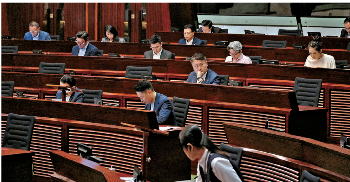
●立法會昨日首讀及二讀《北部都會區發展條例草案》。