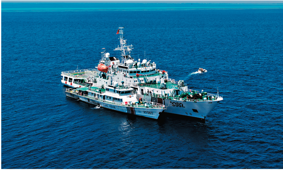
●中方《報告》認為，菲律賓領土主張缺乏基本的史實依據，且明顯違背有關領土取得的國際法規則，不具備歷史法理基礎。圖為早前，中國海警川山艦在黃岩島海域巡航值守。

菲律賓領土邊界的歷史法理評估項目由自然資源部海洋發展戰略研究所倡議發起，多個機構的歷史學和國際法等學科專家組成專家組，共同編制完成《報告》，旨在檢視菲律賓在南海提出的領土主張是否與公認國際法規則和公開的可信史料一致，以確定其相關領土主張是否符合國際法。