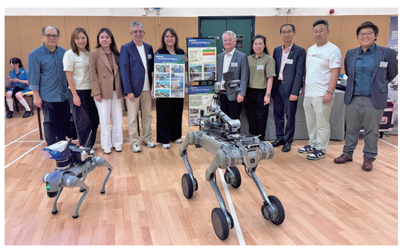
▲▼環保署在7月5日舉行同樂日，推廣國安和環保。

此外，為深化國家安全教育與環境保護的連結，環保署亦於7月期間在沙田區舉辦《遇見美麗中國》-國安·環保·同樂日，面向公眾闡述國家安全的重要性及其與環境保護的相互關係，進一步將國安教育由校園擴展至社區層面。