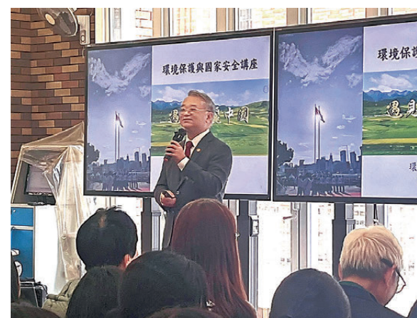
▲環保署署長徐浩光宣傳《遇見美麗中國》同樂日。