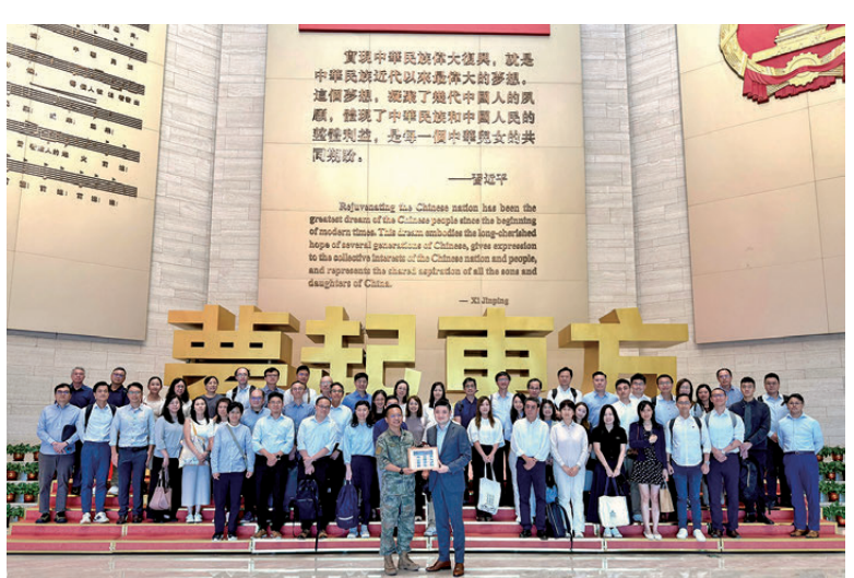
▲▼環保署同事分別於2026年4月28日及6月10日到昂船洲解放軍駐港部隊展覽中心參觀。

除了課堂學習，實地體驗同樣重要。為讓國家安全教育更內化於心，環保署於4月及6月先後兩次組織專業職系人員參觀昂船洲解放軍駐港部隊展覽中心，讓大家透過沉浸式學習，感受國家國防建設的輝煌成就，深化國防及國家安全的認識，從中厚植愛國情懷、強化使命擔當。