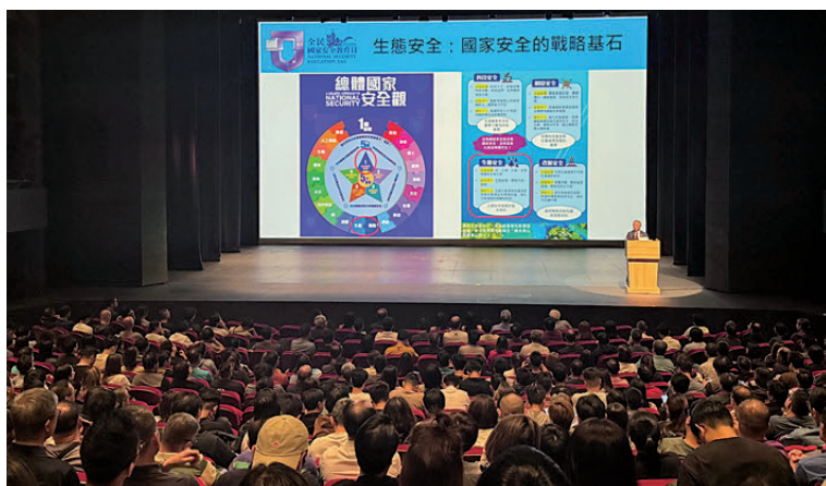
▲4月16日，前線同事學習如何把工作跟國家安全相結合。

環境生態的安全與保護，是國家安全體系其中重要一環。環境保護署（環保署）作為香港特別行政區政府負責環境保護工作的主要部門，肩負維護國家生態安全、推動綠色發展的重要使命。為深入貫徹總體國家安全觀，增強全體人員國家安全意識，環保署於2026年積極舉辦及參與多項國家安全教育活動，包括學習全國兩會精神座談會、國家安全教育前線人員分享會、參觀昂船洲解放軍駐港部隊展覽中心，以及「環境教育校園巡迴分享會」之《遇見美麗中國》及《美麗香港系列》等，範圍涵蓋內部培訓、前線人員教育及校園推廣等多個層面，旨在將國家安全教育融入日常工作，並透過校園巡迴向新一代傳承愛國護港、守護綠色家園的責任擔當。