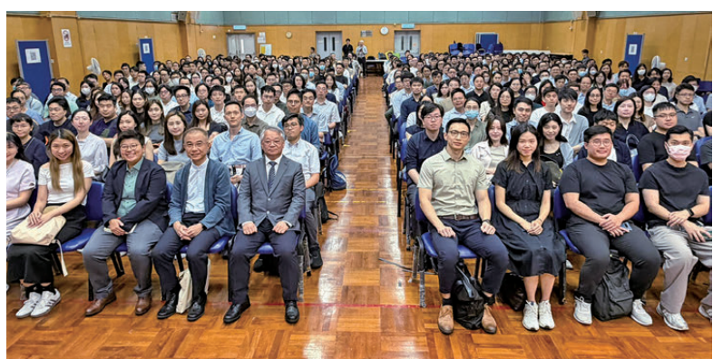
▲環境保護署專業職系人員於「學習全國兩會精神座談會」上合照。

兩場座談會讓各級人員深入學習全國兩會精神，掌握國家最新環保政策及法規方向，強化維護國家生態安全的責任擔當，並將所學融入日常環保工作，助力香港融入國家發展大局。