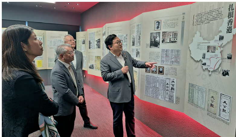
▲環保署署長徐浩光到訪香港大公文匯傳媒集團參觀報使館。

徐浩光亦提醒前線人員，日常巡查除執行環保法規外，需提高防火意識，留意露天回油場、非法加油站等高風險場所，發現問題及時通報消防處等部門。在生態環保與宣傳教育方面，他分享了國家三北防護林工程等生態治理成效，並且勉勵同事牢記使命，在日常執法中兼顧環保法規與安全意識。