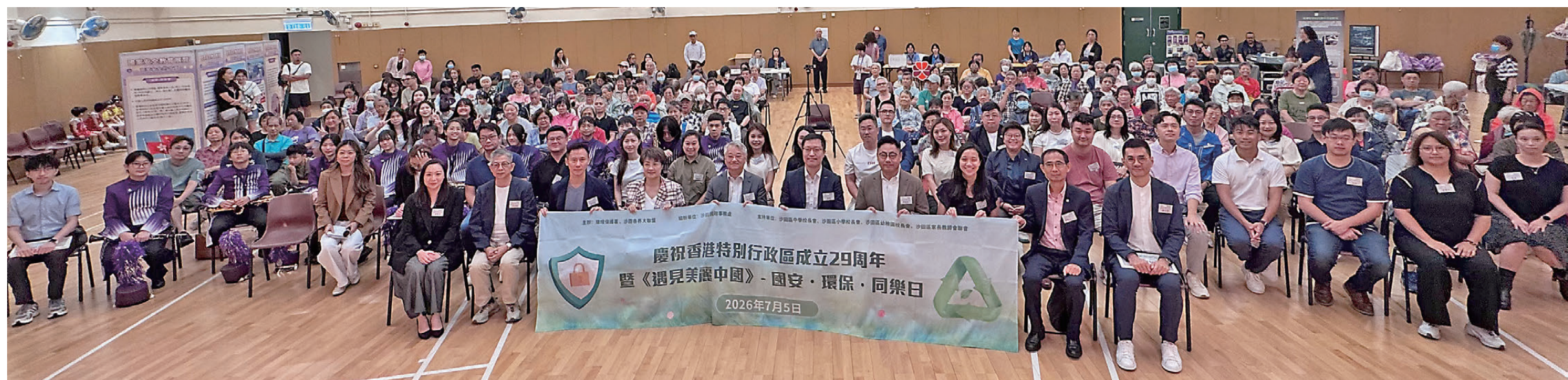
▲7月5日，環保署與沙田各界大聯盟攜手於沙田馬鞍山利安邨社區會堂舉辦「慶祝香港特別行政區成立29周年暨《遇見美麗中國》-國安·環保·同樂日」，環保署署長徐浩光親臨主講並於會上與一眾來賓合照。

環境生態的安全與保護，是國家安全體系其中重要一環。環境保護署（環保署）作為香港特別行政區政府負責環境保護工作的主要部門，肩負維護國家生態安全、推動綠色發展的重要使命。為深入貫徹總體國家安全觀，增強全體人員國家安全意識，環保署於2026年積極舉辦及參與多項國家安全教育活動，包括學習全國兩會精神座談會、國家安全教育前線人員分享會、參觀昂船洲解放軍駐港部隊展覽中心，以及「環境教育校園巡迴分享會」之《遇見美麗中國》及《美麗香港系列》等，範圍涵蓋內部培訓、前線人員教育及校園推廣等多個層面，旨在將國家安全教育融入日常工作，並透過校園巡迴向新一代傳承愛國護港、守護綠色家園的責任擔當。