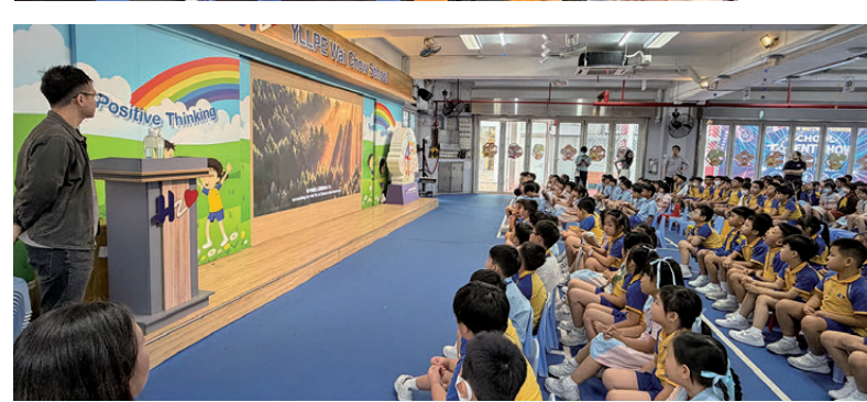
▲5月26日於順德聯誼總會胡兆熾中學舉辦「環境教育校園巡迴分享會」現場。

活動涵蓋自然保育、可持續發展、新能源、綠色交通及低碳生活等主題，透過展示國家壯麗自然風光、生物多樣性及生態保育成果，讓學生認識國家生態文明建設的顯著成就；同時透過《美麗香港系列》的片段，展示香港本地生態環境與保育工作，培養學生對國家及香港的歸屬感與責任擔當。