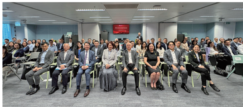
▲李慧琼向環境及生態局轄下部門解說全國兩會精神。

4月14日首場座談會邀請了港區全國人大常委會委員李慧琼擔任主講嘉賓，並採用現場及線上雙軌模式，現場約100位環境及生態局首長級人員出席，線上約300位專業職系人員參與。會上，李慧琼重點分享國家將於8月15日起施行的《中華人民共和國生態環境法典》，並強調了法典的實施對香港的環境保護、綠色低碳轉型及可持續發展具有重要啟示意義，香港必須積極對接國家戰略，在減排、能源安全、綠色科技等方面貢獻香港所長。