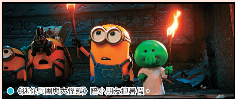
●《迷你兵團與大怪獸》陪小朋友迎暑假。

為他們根本唸不出對白！主角占士不甘放棄電影夢，聯同好友阿亨和阿德拍攝一部怪獸電影，卻意外將真正的怪獸釋放，釀成彌天大禍。電影向差利卓別靈、巴士達基頓等默劇大師致敬，同時融入導演童年對經典怪獸的迷戀，但最核心的仍是迷你兵團之間那份真摯的友誼與夢想——只要朋友在旁，追夢就不再可怕！這亦令電影比前作多了一層溫度。