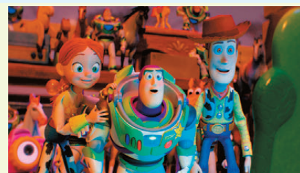
● 大家最熟悉的玩具角色，再度開心回歸大銀幕。