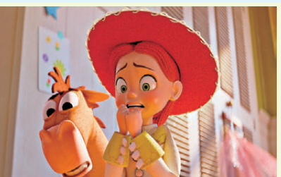
● Taylor Swift 親自為《反斗奇兵5》打造原創歌曲《I Knew It, I Know You》。