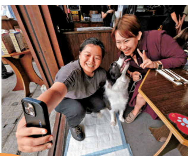
●狗隻與主人在餐廳內親密、開心互動。