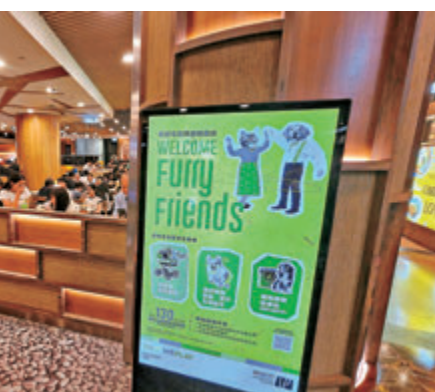
●旺角朗豪坊獲批狗隻進入的食肆，在顯眼位置張貼標示。