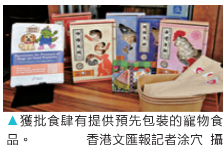
▲獲批食肆有提供預先包裝的寵物食品。