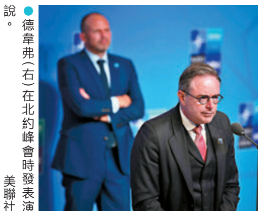
●德韋弗(右)在北約峰會時發表演說。

香港文匯報訊 北約峰會的聯合聲明並未掩飾特朗普的濃重火藥味，向來為特朗普拍馬屁的北約秘書長呂特，今次也努力解畫。面對北約內部的明顯分歧，呂特竟聲稱特朗普與北約其他成員國領導人爭執後再達成共識，能夠體現所謂團結力量，對俄羅斯總統普京有啟發作用。