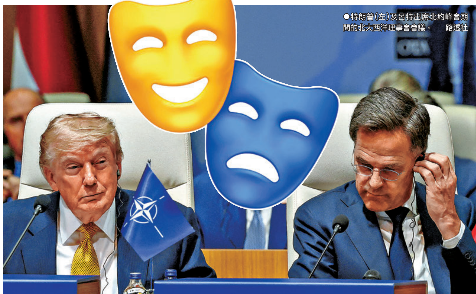
●特朗普(左)及呂特出席北約峰會期間的北大西洋理事會會議。

香港文匯報訊 北約峰會7月7日至8日在土耳其首都安卡拉舉行，各成員國會後發表《安卡拉峰會宣言》，宣布軍事採購、對烏克蘭軍援等一系列承諾。美國總統特朗普於閉門會議結束後召開記者會，他一改早前對北約盟友在伊朗衝突中不願助力的不滿，宣稱是次峰會展現出巨大團結，又暗示西班牙願意配合美方要求，跟從其他北約成員國增加國防開支至國內生產總值（GDP）的5%。