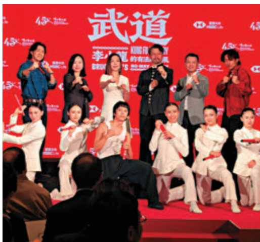
●大型舞劇《武道》中國內地巡演發布會昨日舉行。