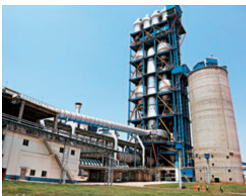
●中國始終毫無保留地分享經驗，幫助全球南方國家發展。圖為中非合作項目埃塞俄比亞萊米國家水泥廠。