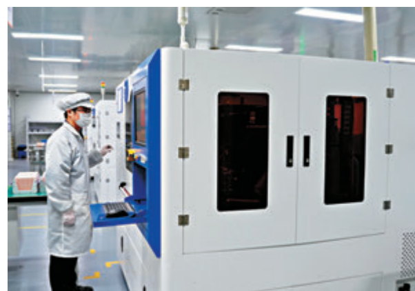
●氬氣在半導體加工領域發揮着愈發關鍵作用。圖為早前技術工人在寧波江豐同芯半導體材料有限公司的智能生產車間作業。

體產業不僅服務內需市場，大量自研自產芯片產品對外出口，還有支撐全球產業鏈供應穩定運轉的作用，因此，國內氬氣的穩定供給至關重要。「基於當前供需緊張的特殊形勢，中國對氬氣實施臨時管制措施。」