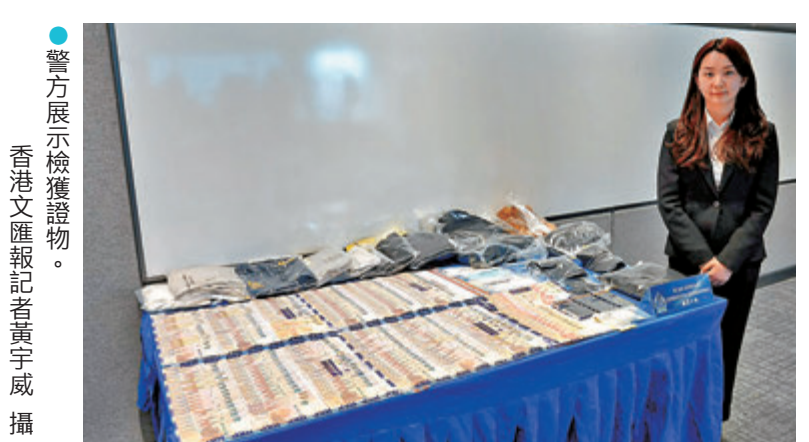
●警方展示檢獲證物。

涉嫌詐騙被捕的兩名男子分別21歲及23歲，俱持雙程證，他們在詐騙集團中擔當收取騙款的「跑腿」角色。兩名受騙長者均是「猜猜我是誰」電話騙案的受害人。