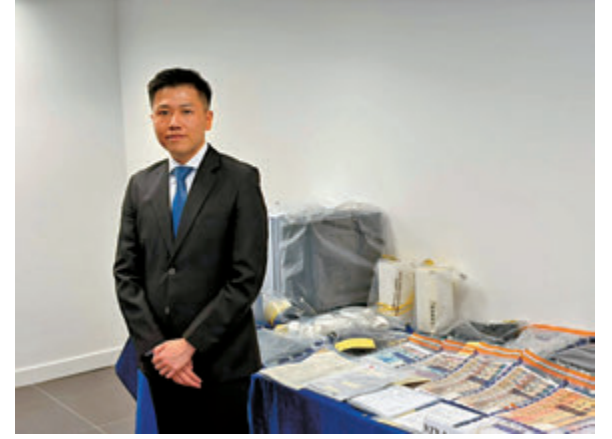
▲警方講述代號「海涯」打擊本地詐騙集團行動成果及展示證物。

賬至指定的傀儡戶口，第二種方式是現金充值，指示受害人攜帶現金自行到尖沙咀一間假冒虛擬貨幣找換店的店舖「充值」，或者安排車輛「點對點」接送受害人到店舖入數，當受害人轉賬或入數完畢，手機「FactorOne」應用程式會彈出成功充值的提示。但實際上，受害人「FactorOne」戶口顯示的成功入金、獲利全是虛假表象。