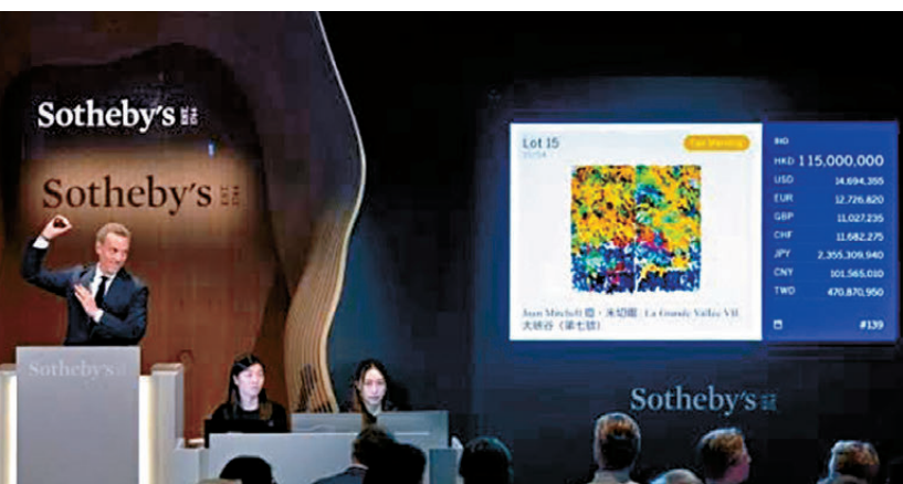
●瓊·米切爾作品《大峽谷(第七號)》以1.37億港元成交。