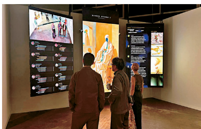
●2026年香港巴塞爾藝術博覽會，藏家駐足觀看數碼藝術品。