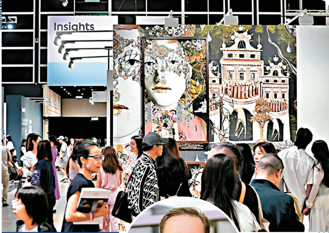
▲2026 香港巴塞爾展會現場。