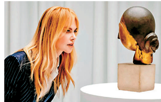
●Nicole Kidman 為佳士得宣傳《達那俄斯之女》，該作品以1.076億美元成交。